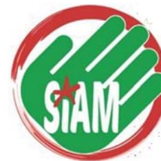
SIAM de Apoyo Mútuo