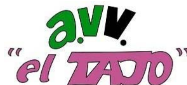
Asociación de Vecinos El Tajo