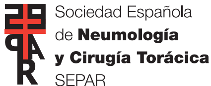
Sociedad Española de Neumología y Cirugía Torácica SEPAR