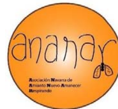
Ananar Asociación Navarra de Amianto Nuevo Amanecer Respirando