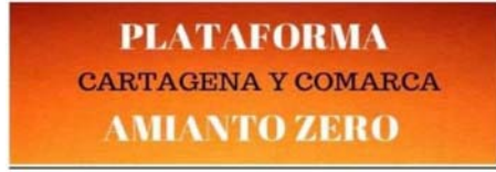
Amianto Cero Cartagena y Comarca