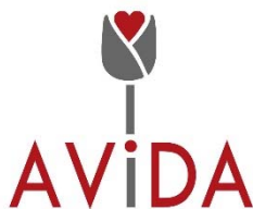
Avida Asociación de Víctimas del Amianto