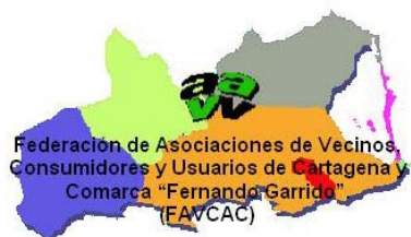
Federación de Asociaciones de Vecinos, Consumidores y Usuarios de Cartagena y Comarca «Fernando Garrido»