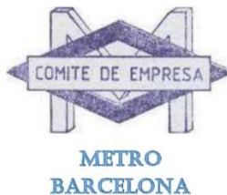
Metro de Barcelona (FMB) - Comité de Empresa