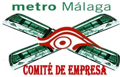
Comité de Empresa Metro Málaga