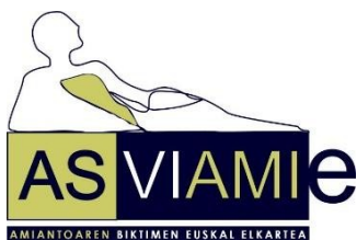
Asviemie Asociación de Víctimas del Amianto de Euskadi