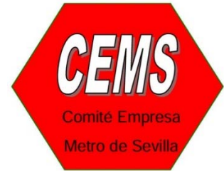
Comité de Empresa Metro Sevilla