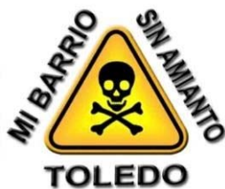
Mi Barrio sin Amianto